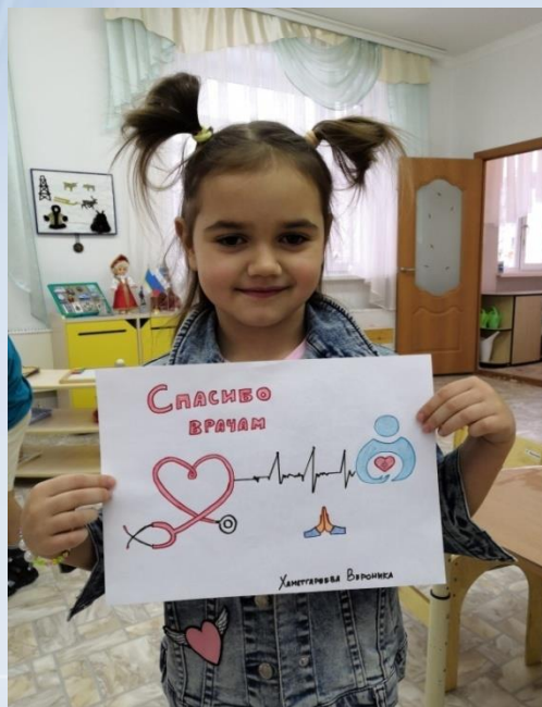
Участие в онлайн-марафонах