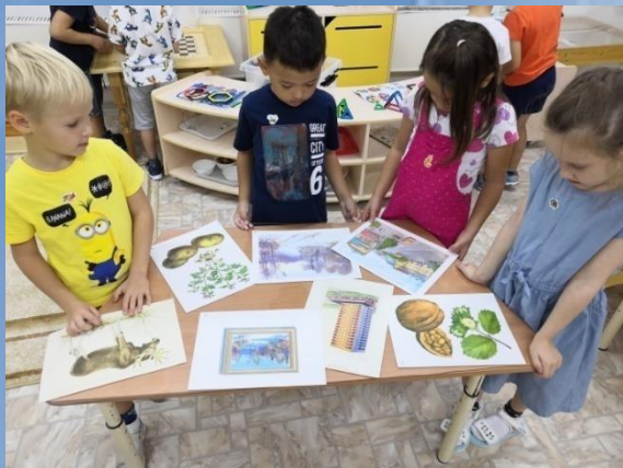
Решение проблемной ситуации